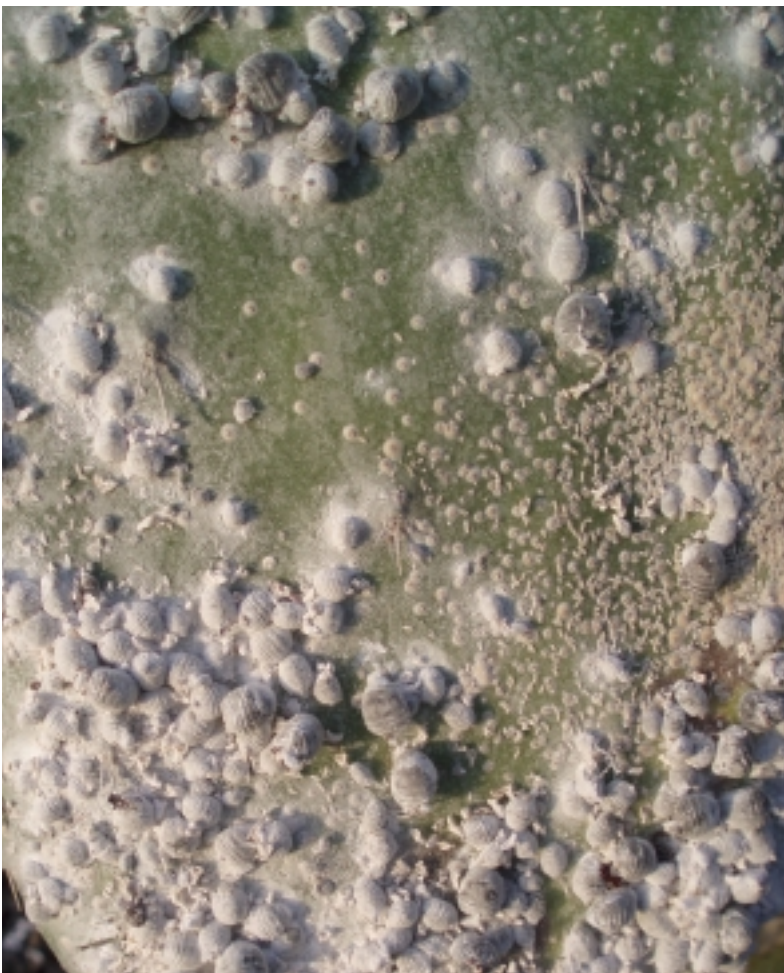
Unten: Koschenille-Larven auf einem Opuntienblatt.

welche dazu führte, dass der Weinanbau zu Mitte des 19. Jahrhunderts darniederlag. Da sich gegenwärtig Mexiko auf die Koschenille-Produktion besinnt und dort die Arbeitskräfte bedeutend billiger sind als auf den Kanaren, lohnt sich das Sammeln der Koschenille-Larven sowie ihre Behandlung bis zur endgültigen Gewinnung des Karmin auf den Kanaren kaum noch. Ein Bauer kann an einem Tag rund 3 bis 4 kg "ernten". 1 kg Trockenmasse bringt dem bäuerlichen Produzenten rund 25 €, jedoch ist nicht etwa jeder Tag im Jahr ein Erntetag! Es lassen sich rund drei Ernten pro Jahr erzielen, bei gutem Wetter auch mehr.