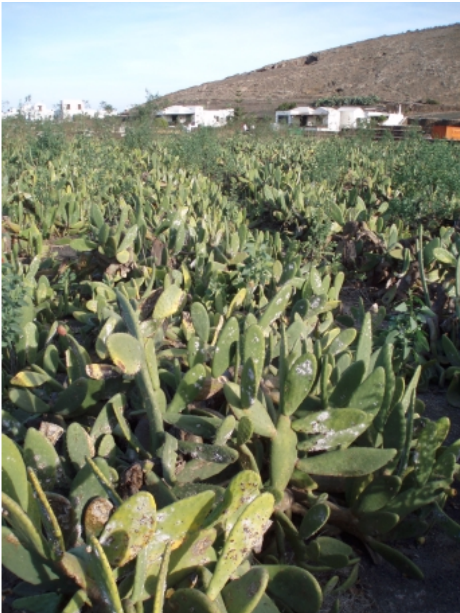
In Reihen gepflanzte Opuntien auf Lanzarote.

Auf den Kanarischen Inseln mit ihrem Oaxaca vergleichbaren Klima wurden Opuntienkakteen und Koschenille Mitte des 19. Jahrhunderts angesiedelt. Als besonders günstig hat sich die regenarme Vulkaninsel Lanzarote erwiesen. 1853 gilt als das Jahr des Beginns der dortigen Karmin-Gewinnung. Anlass dazu war eine Mehltau-Plage,