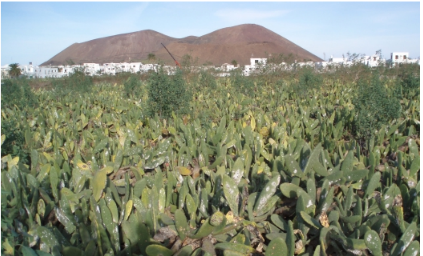
Oben: Opuntienfeld in Guatiza.